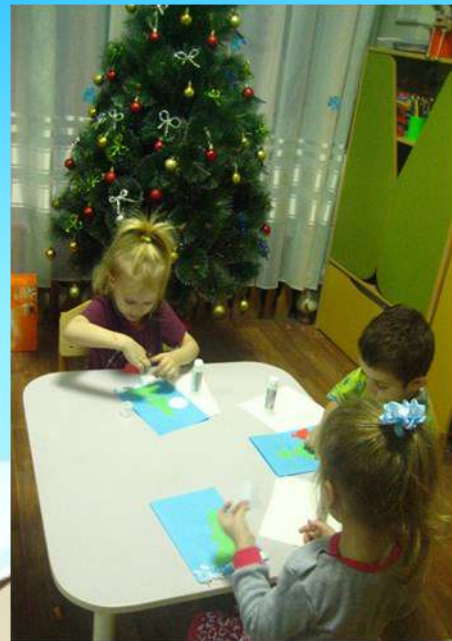
Аппликация «Новогодняя открытка»