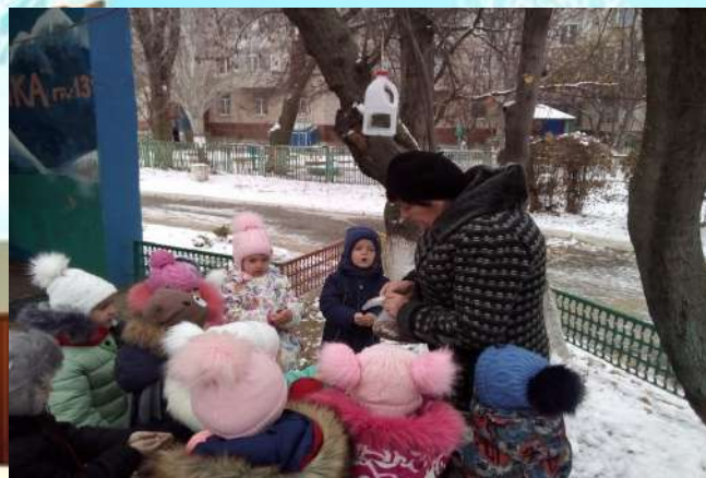
Акция «Покормим птиц зимой» Цель: помочь зимующим птицам в нашем годе пережить зимний период»