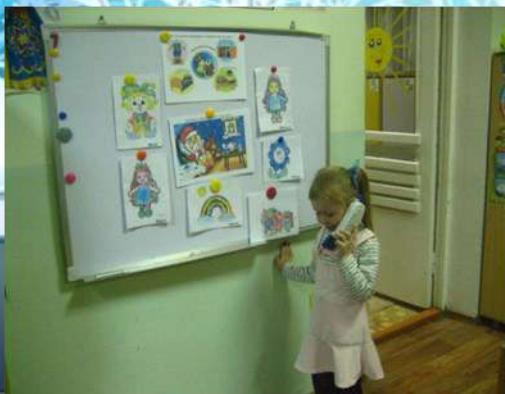
Решение проблемной ситуации Дед Мороз заболел и помочь нам Велел