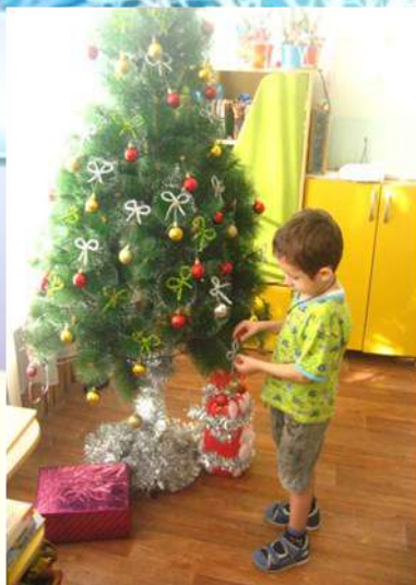
Украшим елочку шариками