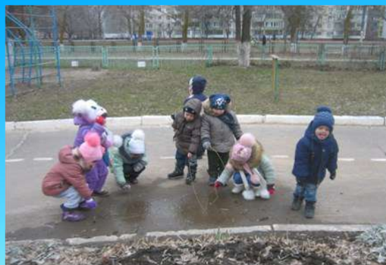
Почему замерзли лужи Установление причинно-следственной связи