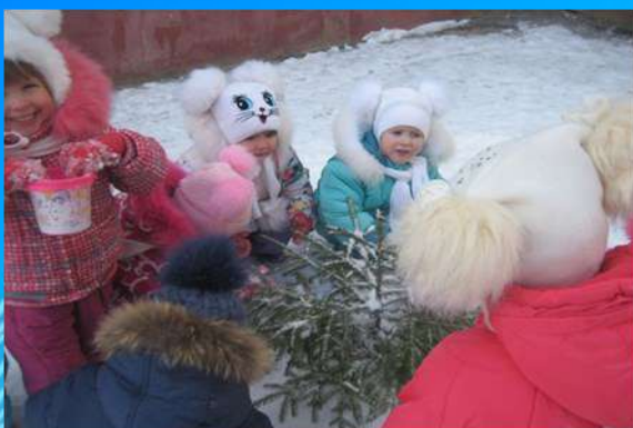
Экспериментальная деятельность Маленькой елочке холодно зимой

Доминирующая область в раскрытии темы – познавательное развитие Цели: расширять кругозор детей, приобщать к русской народной культуре, традициям, расширять знания детей об изменениях в природе.